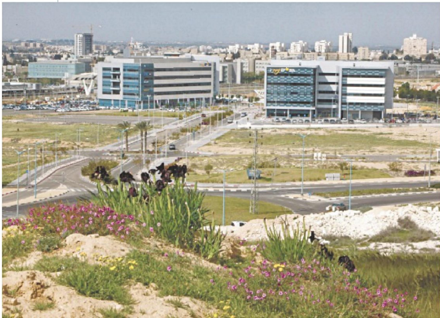
פארק ההייטק בבאר שבע. חלק מהתוכנית למשך אנשי קבע לעיר