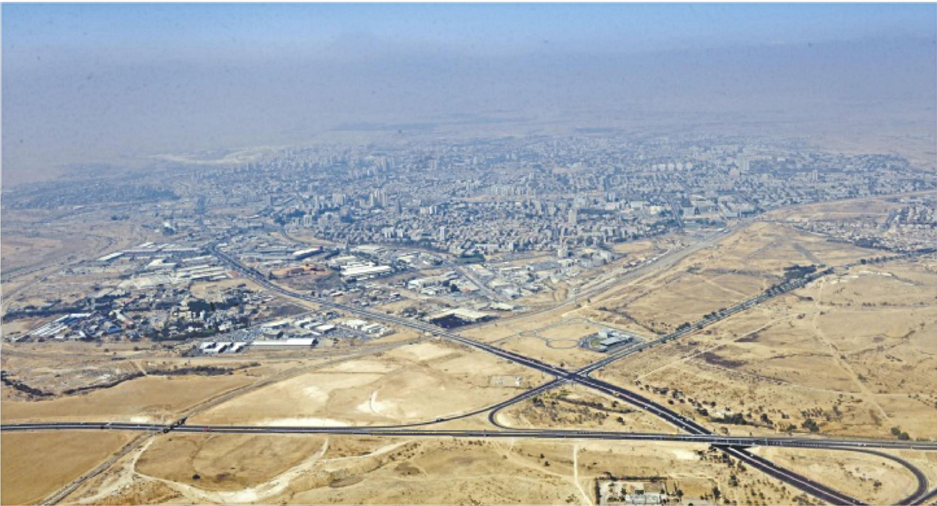
באר שבע. האם היא באמת בירת הסייבר?